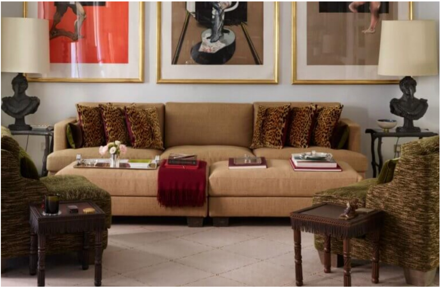
Au-dessus du canapé dessiné par Francis Sultana, de grandes lithographies de Francis Bacon dynamisent la pièce. La paire de lampes est de Garouste & Bonetti.