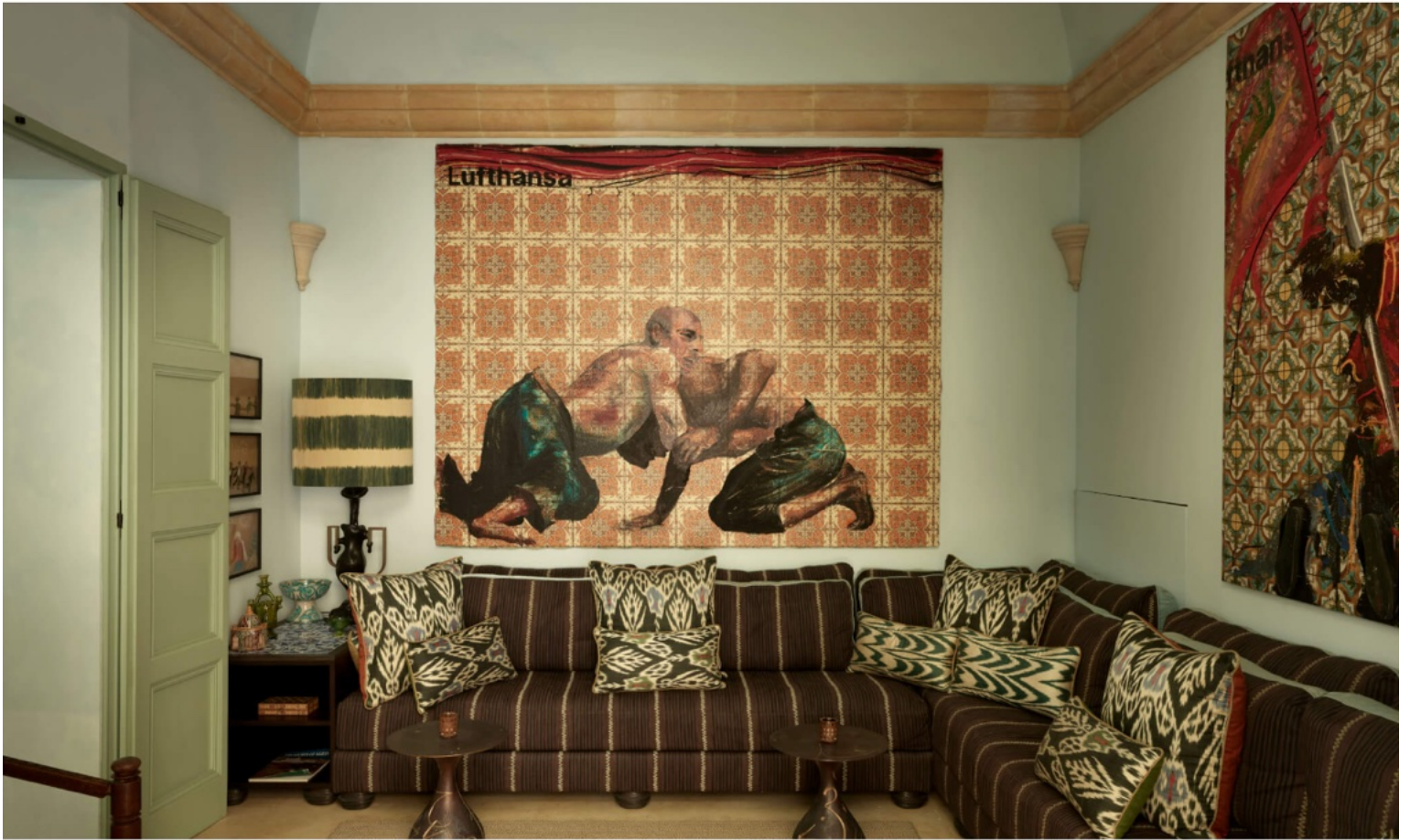
Petit salon avec une touche orientale et une toile d'Aldo Mondino.

campagne anglaise, mais sur la Côte d'Azur, tournée à New York, propriétés au Moyen-Orient, ou encore le fameux hôtel à Capri .