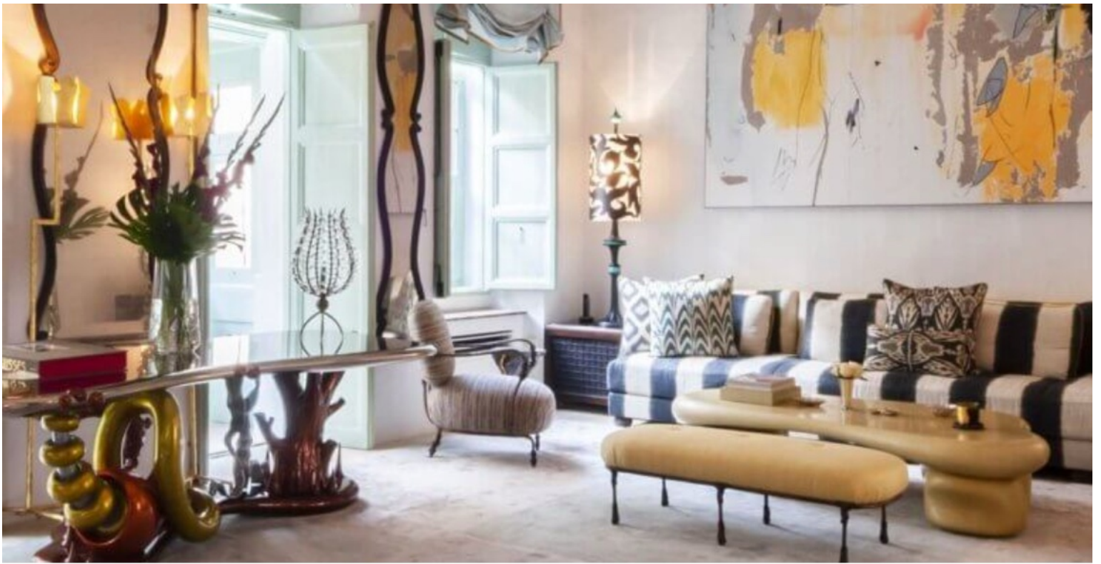
Console de Mattia Bonetti, miroirs d'Oriel Harwood et toile de Secundino Hernandez.