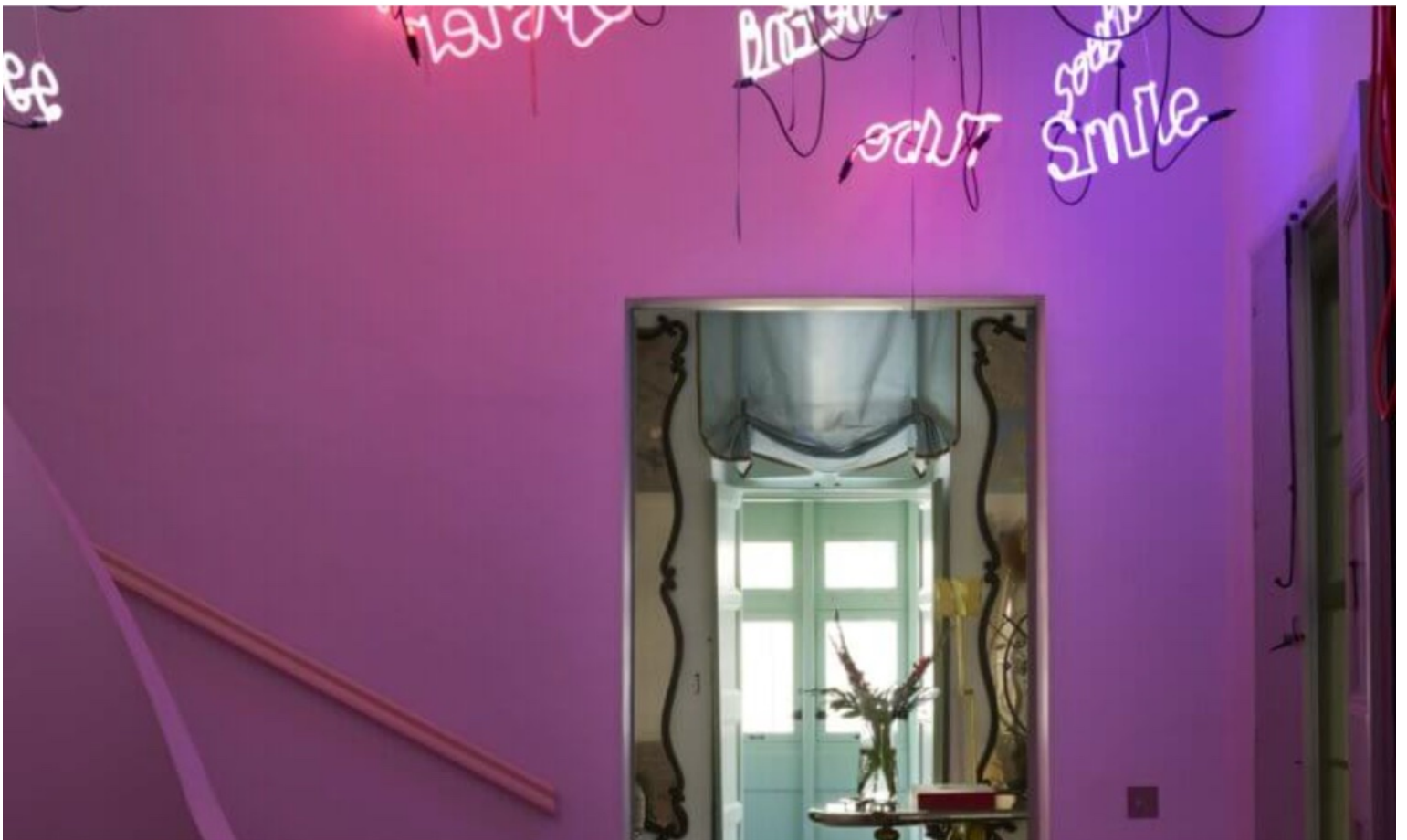
Dans l'escalier, une œuvre spectaculaire de Jason Rhoades.

On s'en rend compte immédiatement la porte franchie. Pas de portrait de