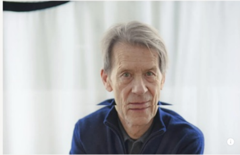
SOPHIE MASSALOVITCH · 7 AVRIL 2026 À 13H40 · LECTURE 6 MIN

P aris, XI e arrondissement. A quelques pas de l'avenue Parmentier, une rue tranquille en bordure d'un square. Les petits commerces d'autrefois ont cédé la place à des bureaux. La plupart conservent leur devanture traditionnelle et leurs volets en bois qui se replient le soir. Dans la vitrine de l'une de ces anciennes échoppes, le passant aperçoit une collection de modèles réduits. Un guéridon, un canapé, une table basse, un lampadaire : on pense d'abord à des jouets. La précision des détails, la subtilité des teintes suggèrent autre chose. Ce sont les maquettes, réalisées en terre cuite, de quelques-uns des meubles et luminaires imaginés par Mattia Bonetti. Leur style flirte avec le baroque, ou, au contraire, épouse l'épure la plus parfaite. « Il n'y a pas de fil qui relie mes créations, je me réinvente à chaque projet », explique le designer.